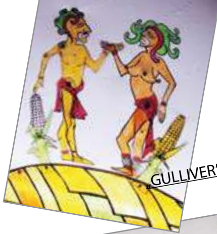
"GULLIVER" Puppet Theatre, Galati, Romania