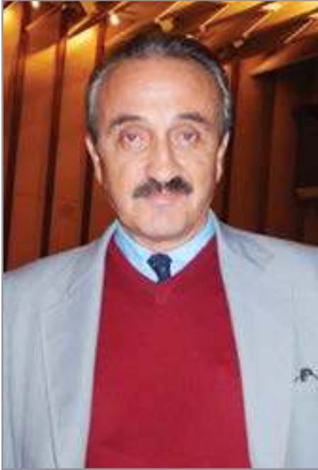
Ion Parhon Președinte Juriu

Toamna asta, în Capitală, care foiește de zarva alegerilor și a incidentelor electorale trebuie să ai mult curaj ca să organizezi încă un festival, în invazia de evenimente în Casa Thaliei. Ei bine, acest curaj alimentat de un orgoliu sănătos și vecin cu o regală nebunie a generat și totodată a înnobilat eforturile Teatrului „Țândărică” din București de a organiza un amplu festival internațional dedicat nu numai copiilor, ci și adulților. Un festival de nota zece, conceput ca un omagiu la adresa ingenuității, a vitalității histrionice și a rafinementului artei păpușarilor și ca un răspuns la eterna noastră nevoie de joc și de vis, de sărbătoare a copilăriei.